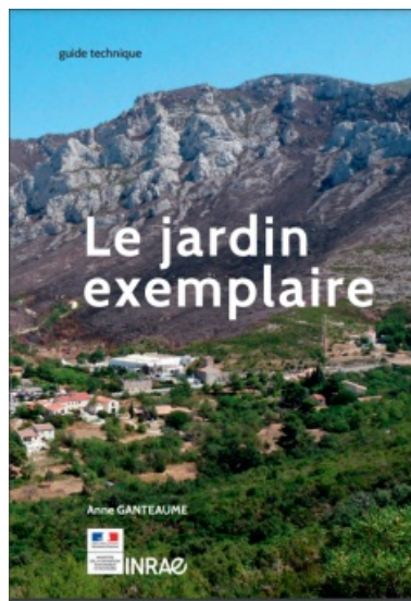
Photo de couverture L'incendie de Marseille (2009) atteint les habitations en interface habitat-forêt au sud de la