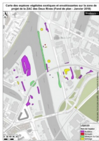
Figure 2 - Carte sur l'état de plan des espèces végétales exotiques envahissantes - ZAC des 2 Rives - Janvier 2018