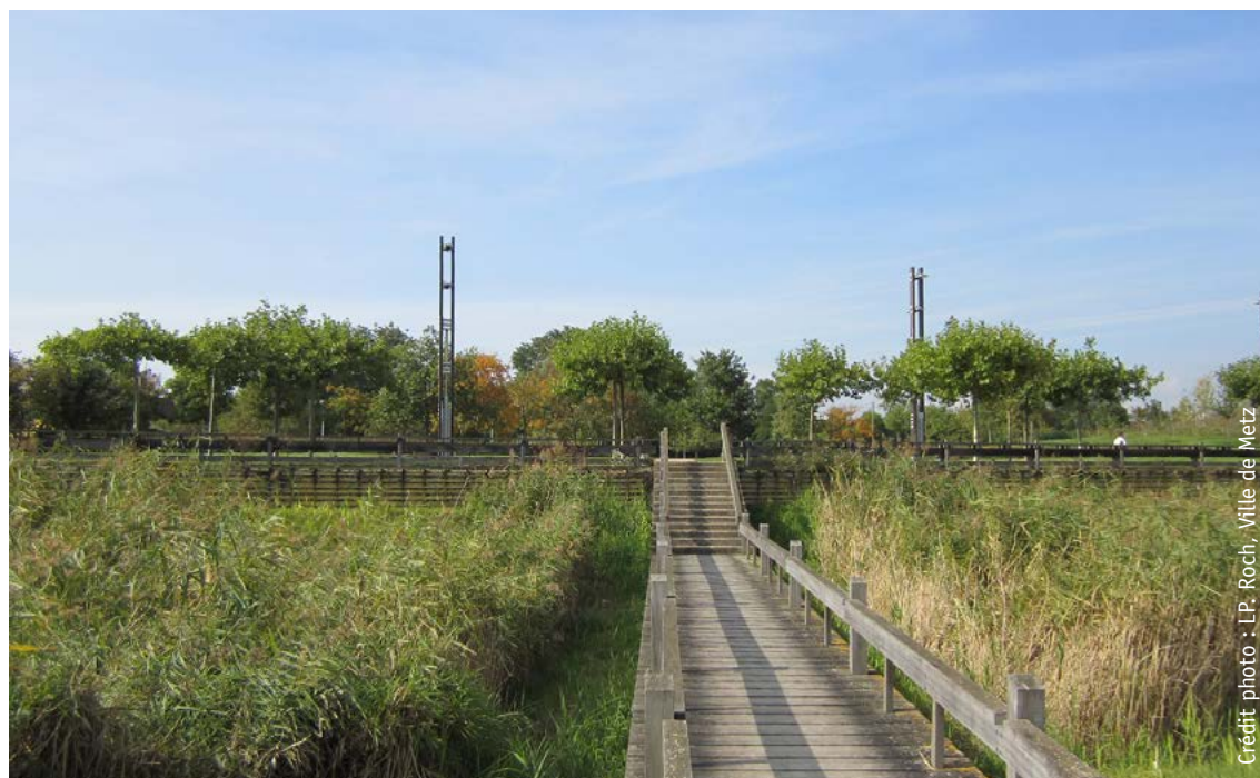
«La roselière» joue un rôle pour le traitement des eaux pluviales. Parc de la Seille, labellisé EcoJardin® en 2012, Metz (57).

Souvent oubliés dans la gestion, les fontaines et bassins sont à prendre en compte dans une démarche de gestion écologique.