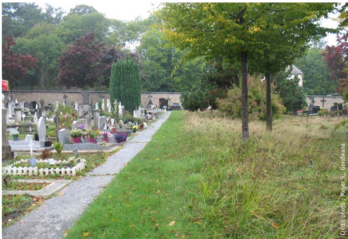
Prairie gérée en tonte différenciée dans le cimetière des Gonards, labellisé EcoJardin® en 2012, Versailles (78)

Ces critères complètent les critères détaillés dans le référentiel général, pour la classe Cimetières de la typologie des espaces verts de l'AITF.