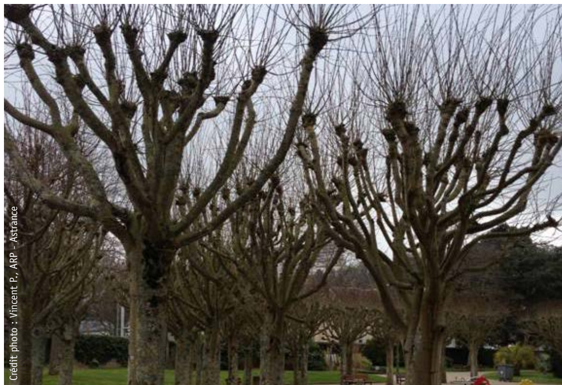
Arbres d'alignement à Cherbourg - Octeville (50), labellisés EcoJardin® en 2013.

Ces critères complètent les critères détaillés dans le référentiel général, pour les classes de la typologie des espaces verts le nécessitant.