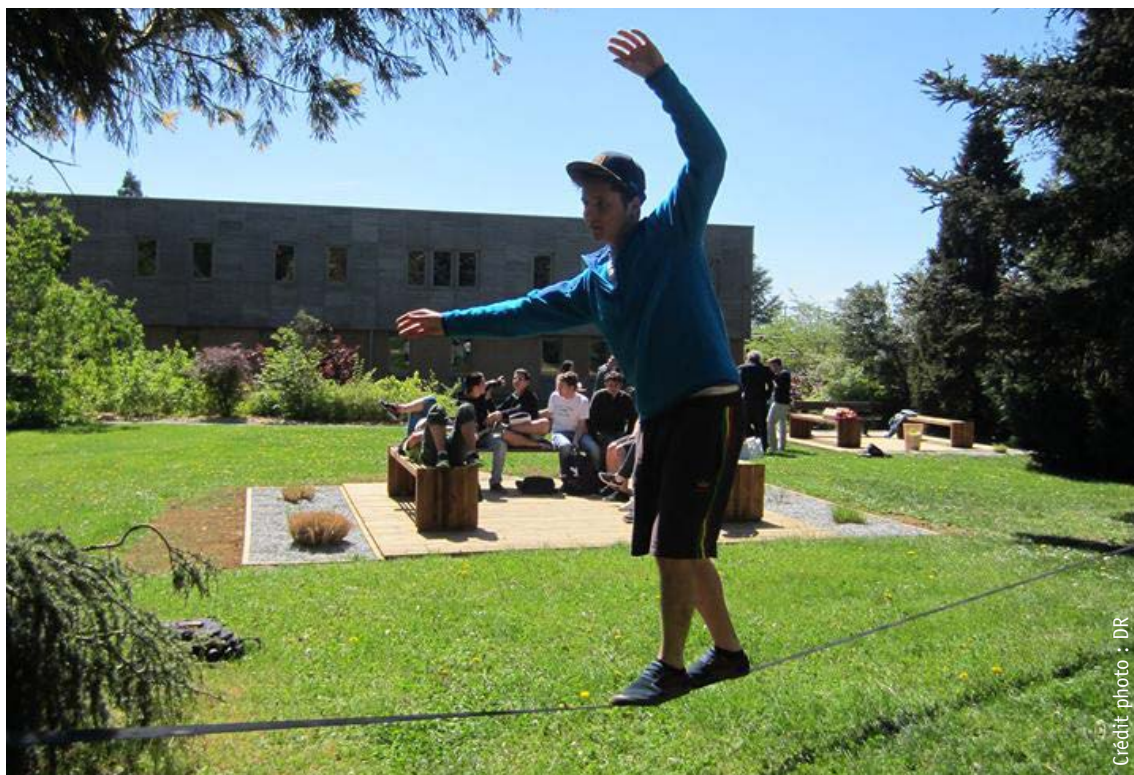
Des étudiants profitent du parc de l'EPLEFPA de Lyon - Dardilly - Ecully, labellisé EcoJardin® en 2014, Dardilly (69)

Ces critères complètent les critères détaillés dans le référentiel général, pour la classe Etablissements éducatifs et sociaux de la typologie des espaces verts de l'AITF.