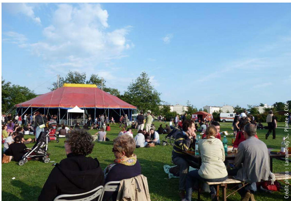
Le festival «Jardin'jazz» mêle animations festives et de sensibilisation à l'environnement (compostage, etc.). Parc potager de la Crapaudine, labellisé EcoJardin® en 2013, Nantes (44)

Enfin, la propreté et la gestion des déchets ménagers sont des aspects à ne pas négliger vis-à-vis d'une démarche environnementale.