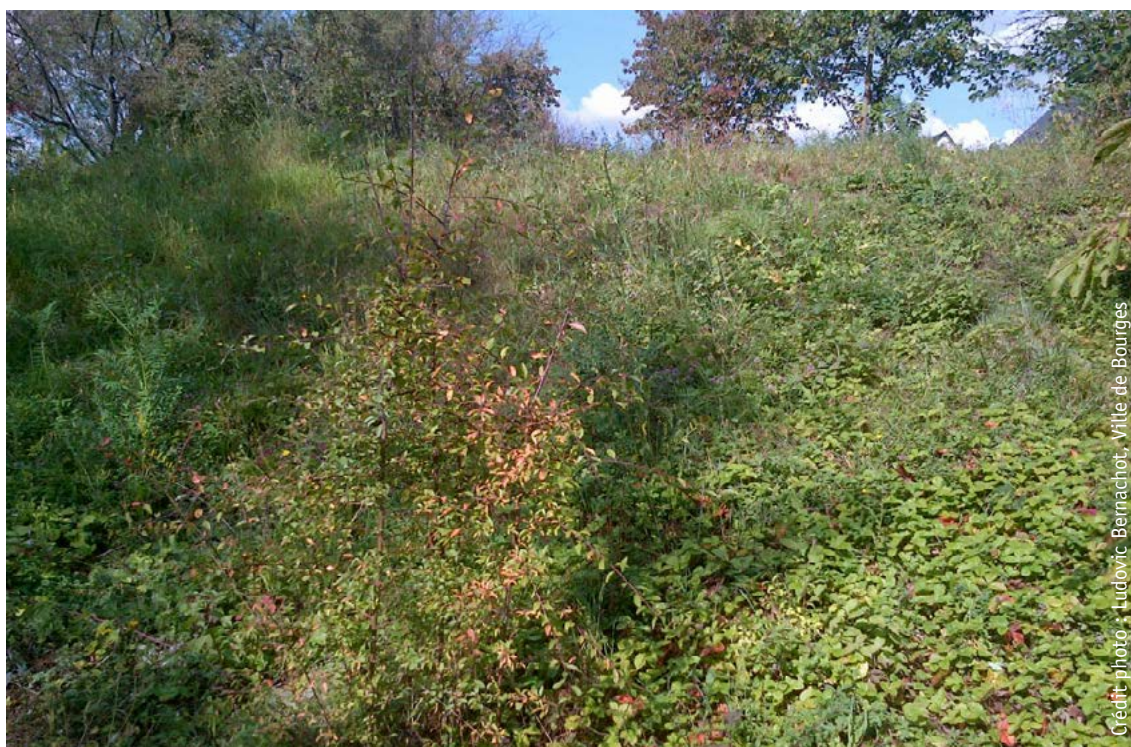
Un exemple de préservation d'un milieu calcaire pauvre en matières organiques et de la diversité floristique et faunistique qu'il accueille. Jardin de Lazenay, labellisé EcoJardin® en 2014, Bourges (18).

Les fonctions écologiques des sols en espaces verts font souvent l'objet d'apports (amendements et fertilisation), mais les stratégies utilisées doivent correspondre à de réels besoins et respecter certains principes.