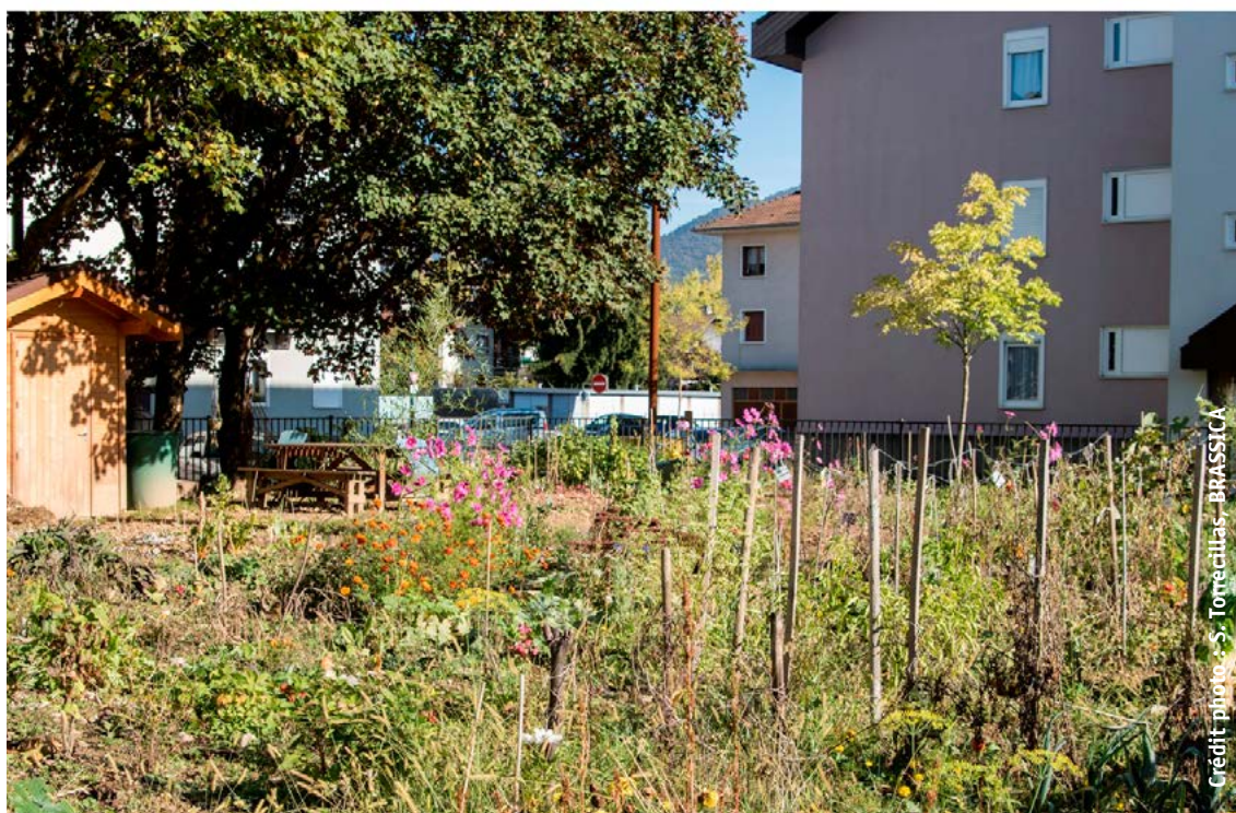
Un jardin familial en coeur de ville à Annecy (74), labellisé EcoJardin® en 2014.

Ces critères complètent les critères détaillés dans le référentiel général, pour les classes de la typologie des espaces verts le nécessitant.