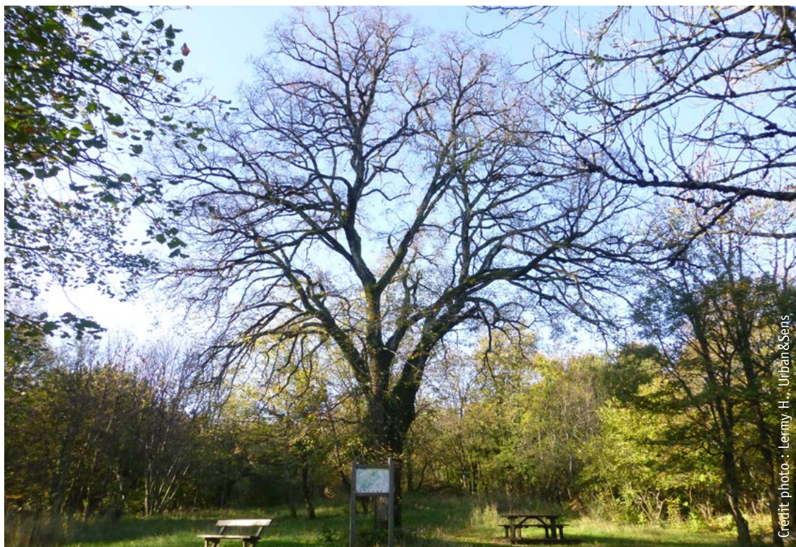
Les collines bisontines, un espace naturel alliant biodiversité et culture aux portes de Besançon (25), labellisé EcoJardin® en 2013.

Ces critères complètent les critères détaillés dans le référentiel général, pour la classe Espaces naturels aménagés de la typologie des espaces verts de l'AITF.