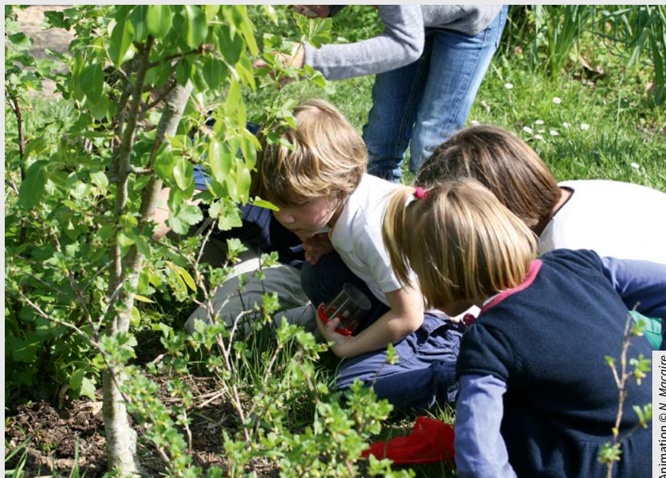
Animation © N. Macaire

En savoir plus : www.vigienature-ecole.fr