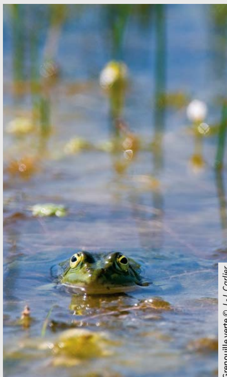
Grenouille verte © J.-J. Carlier

Trame blanche. La ville de Bruxelles a créé une cartographie de l'aire urbaine sur le critère du niveau sonore et elle y a intégré des « Quiet-zone » correspondant à des zones calmes ou zones de confort acoustique en espace public ou dans des quartiers dans lesquels le niveau sonore est plafonné à 55 dB.