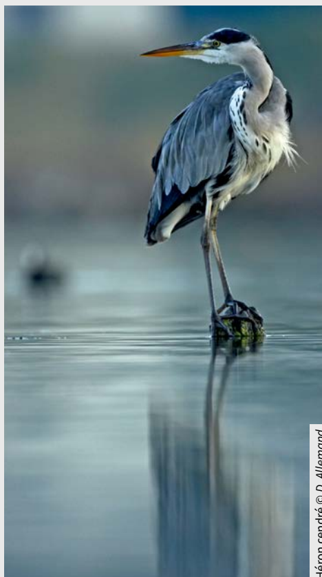
Héron cendré

En savoir plus : https://ceser.bretagne.bzh