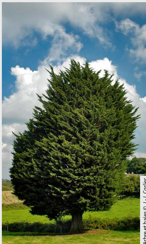
Arbre et haies

En savoir plus : www.capitale-biodiversite.fr