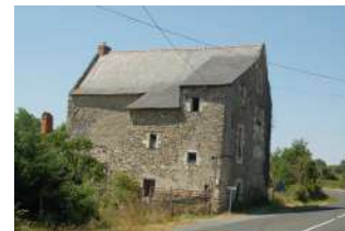
« Luigné » Saint-Lambert- la-Potherie