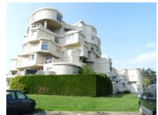
Les Kalougines Angers