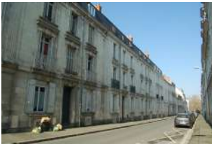
Rue Tarin Angers

Ces fronts bâtis sont des ensembles bâtis séquentiels pour la plupart localisés dans le centre d'Angers et correspondant à une architecture construite en grande partie au XIX ème et début XX ème siècles.