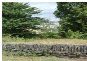
Loire-Authion La Daguenière mur - Les Baillis