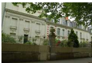
Avenue Jeanne d'Arc Angers