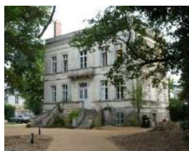
57 rue Volney Angers