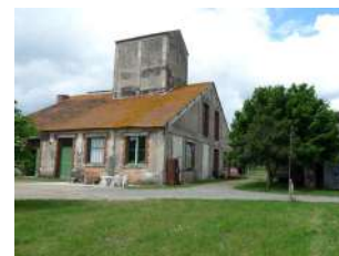
Usine de l'île d'Amour Ecouflant