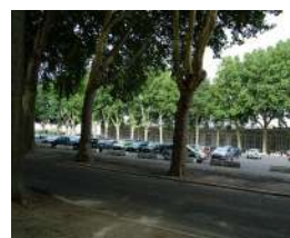
Place de la Rochefoucault Angers