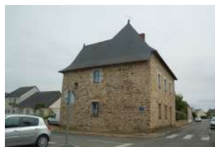
Poste de Garde Le Plessis-Macé