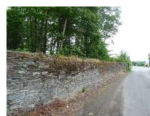
Chemin des Landes Trélazé