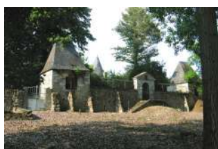
Villa de la Jourdanerie Briollay

Nota : Certains bourgs ou hameaux, bien que situés en bord de rivière, mais dont l'intérêt dominant n'est pas en lien avec l'eau, ne sont pas classés dans cette catégorie.