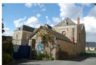
Ancien presbytère Trélazé

Sont identifiés dans cette sous-catégorie des bâtiments construits pour un usage culturel : églises, couvents, chapelles, oratoires, presbytères, etc.