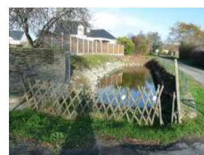
Les Balluères Soulaines-sur-Aubance