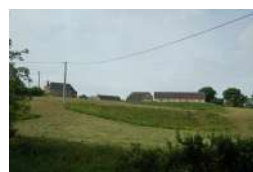
La Haute Roussière La Membrolle-sur- Longuenée