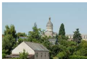
Couvent des Servantes des Pauvres 49 rue Parmentier Angers