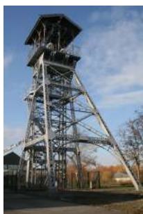
Chevalement Eiffel Trélazé

Sont identifiés dans cette sous-catégorie des bâtis d'intérêt de par leur singularité liée à leur usage technique actuel ou antérieur et marquant dans le paysage tel que : les moulins à vent/eau, les maisons d'éclusier, les chevalements, etc.