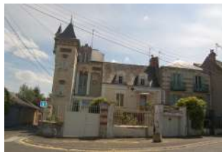
Port du Grand Large Les Ponts-de-Cé