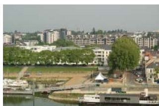
Cale de la Savatte Angers

Sont identifiés dans cette sous-catégorie des espaces ouverts de qualité de par leur organisation et parfois la qualité du bâti les structurant. Il s'agit d'espaces plus ou moins végétalisés, reconnus pour leur qualité urbaine (places urbaines majeures, square, etc.)