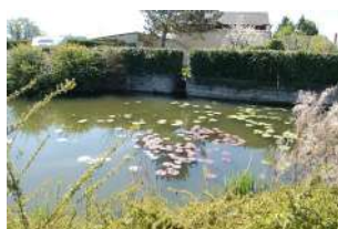
La Basse Marzelle Soulaines-sur-Aubance

Sont identifiés dans cette sous-catégorie des mares maçonnées et des lavoirs, les plus marquants dans le paysage ou identitaires d'un paysage.