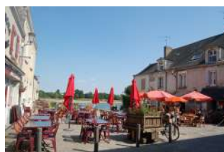
Port de la Pointe Bouchemaine