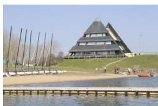
Centre nautique Angers

Sont identifiés dans cette sous-catégorie des bâtiments à usage culturel et d'intérêt de par leur architecture singulière telle que des équipements scolaires : écoles, collèges, etc.