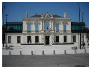
Hôtel de ville Trélazé