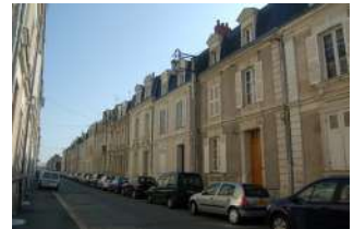
Rue du Quinconce Angers