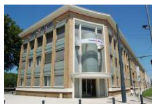
Ancienne Usine des Luisettes Angers