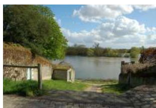
Venelle d'accès à la Loire Sainte-Gemmes-sur-Loire