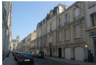
Rue des Arènes Angers