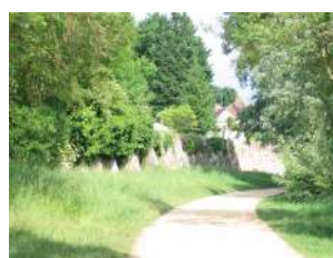
Mur d'enceinte du Château du Plessis-Macé