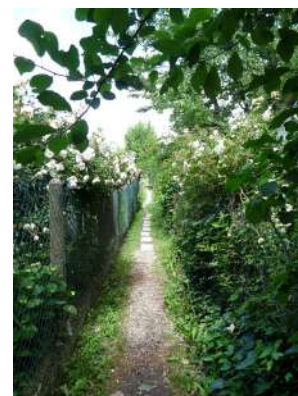
Venelles de la Chalouère Angers