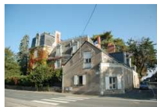
Maison de Maître « la Bénéttrie » 110 rue du Maréchal Juin Angers