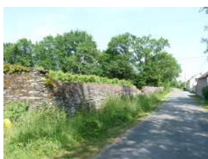
Chemin du Loir La Roche Foulques

Sont identifiés dans cette sous-catégorie les murs et les murets identitaire d'un paysage de par leur linéaire important, et/ou leur très grande qualité