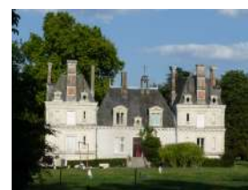
Château de Coincé Feneu