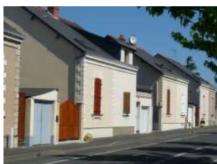
Cité ouvrière de la Lignerie Saint-Barthélemy-d'Anjou

Sont identifiés dans cette sous-catégorie des ensembles qui présentent des séquences de modules singuliers.