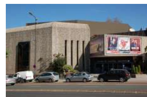
Centre des Congrès Angers