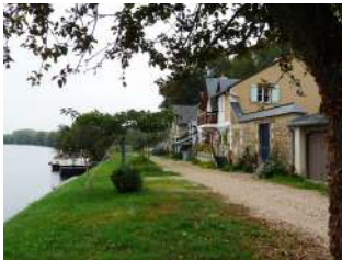
La Roussière La Membrolle-sur-Longuenée

Sont identifiés dans cette sous-catégorie des quartiers, îlots et/ou sites qui présentent un caractère singulier sur le territoire de l'agglomération, par leur organisation, structuration, morphologie, implantation et/ou qualité du bâti, perception depuis l'espace public, intérêt historique, etc.