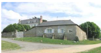
« Le Manoir » Briollay

Nota : Les ensembles remarquables qui font l'objet d'un classement « p » sur le zonage ne sont pas identifiés au titre de l'article L 151-19 (ancien article L 123-1-5-III-2°)