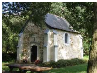
Chapelle de La Touche aux Ânes Saint-Léger-des-Bois