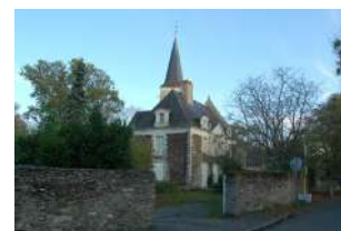
Eglise et presbytère Mûrs-Erigné