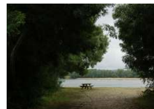
Loire-Authion Saint-Mathurin-sur-Loire Port Pigeau