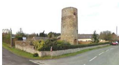
Moulin de la Fenêtre Saint-Martin- du-Fouilloux