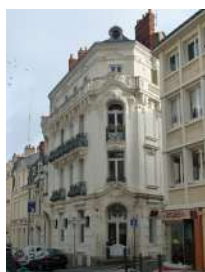
Immeuble baroque 15 rue St Martin Angers

Sont identifiés dans cette sous-catégorie des édifices possédant des caractéristiques architecturales de grande qualité tels que des maisons de maître, des châteaux, des hôtels particuliers, des maisons marchandes, des immeubles de type haussmannien etc.