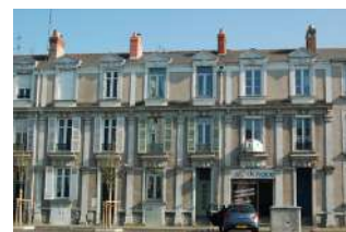
Îlot Carnot / Talet / Buffon / Maine Angers