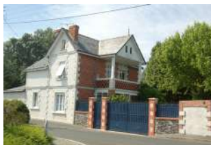
40 Port du Grand Large Les Ponts-de-Cé