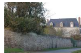
Les Brosses Mûrs-Erigné