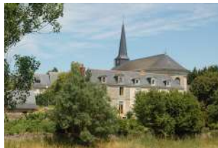
Vue perspective sur l'église Soucelles