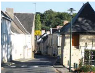
Rue de la Mairie La Meignanne