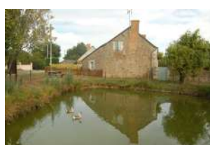
La Haute Grollière Soulaines-sur-Aubance