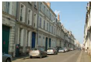
Rue Desjardins Angers