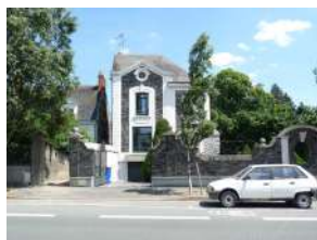
75 rue Jean Joxé Angers