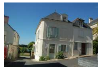
Rue du Port Ecoufant