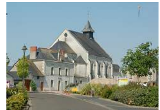
Bourg compact Saint-Martin-du-Fouilloux