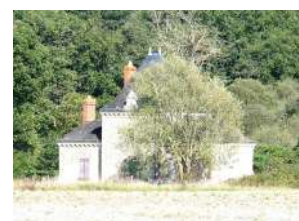
Pavillon de chasse Ecuillé