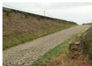
Loire-Authion Saint-Mathurin-sur-Loire rampe d'accès