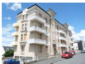
6/8 square Alexandre 1 er Angers

Sont identifiés dans cette sous-catégorie des architectures particulières de par leur usage (équipement, grand magasin, etc.) et/ou de par leur époque de construction (architecture contemporaine) ayant un impact certain sur leur environnement (rue, quartier)