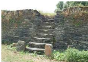
Loire-Authion La Daguenière escalier et mur - Les Baillis

Sont identifiés dans cette sous-catégorie les ouvrages hydrauliques du bord de Loire, héritage de l'économie fluviale du XIX ème siècle, indissociables du paysage ligérien.