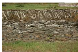
Chemin du Haut de la Baumette Sainte-Gemmes-sur-Loire