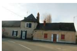
La Chansonnière Briollay

Sont identifiés dans cette sous-catégorie des bâtis correspondant à des exploitations agricoles, horticoles, viticoles, des anciennes fermes, etc. marquant le paysage rural de par leur qualité architecturale et/ou leur volumétrie importante.