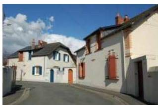
Rue de la Concorde Trélazé