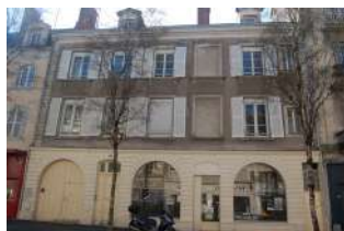
Maison Monsaillé 33 rue Boisnet Angers