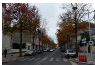
Avenue de Contades Angers