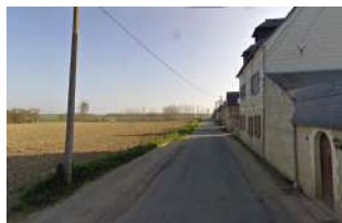
Noyan village Soulaire-et-Bourg